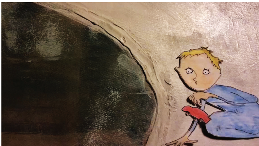
Figur 2: Den røde bilen, utsnitt fra animasjon.