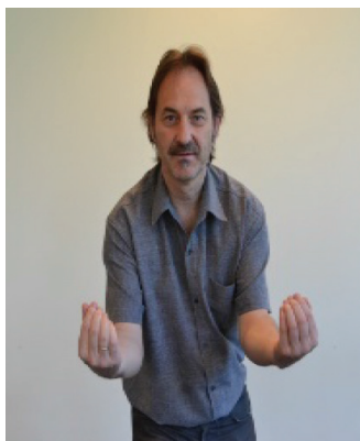
Tegnet for pitch-up .