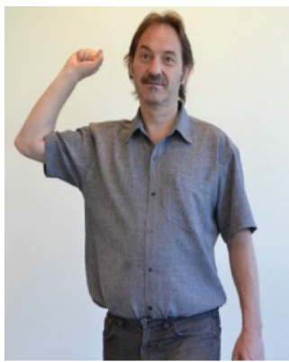
Tegnet for rock (som om du kaster en stein).